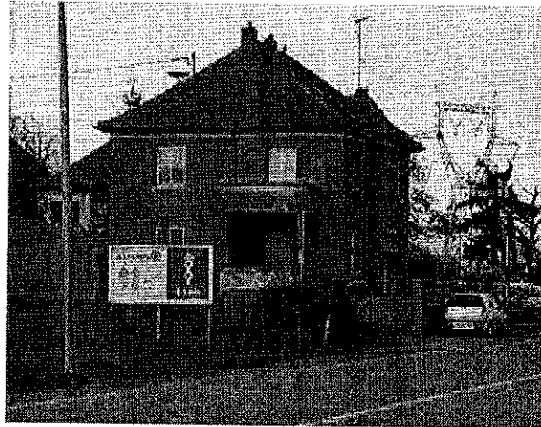
Panneau scellé au sol