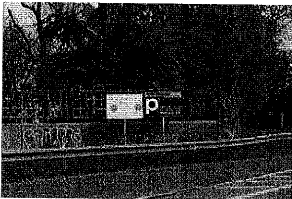
Scellés au sol illégaux.