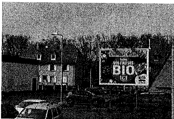
Surface > à 6 m 2

A l'issue de ce diagnostic, les orientations générales suivantes sont proposées :