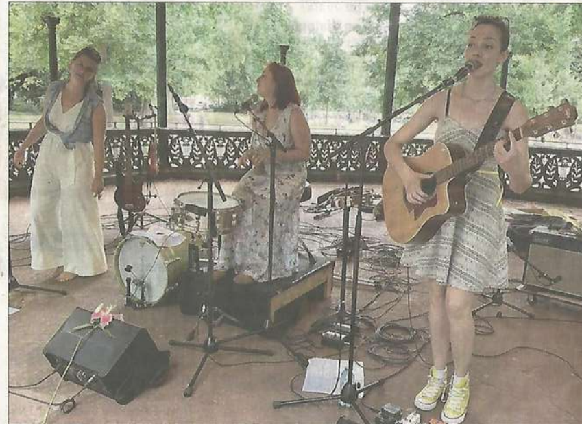
Le trio féminin The Cracked Cookies était à l'affiche du Kiosque en musique ce dimanche 16 août.